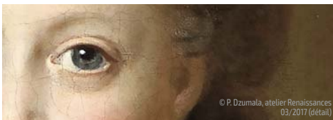
© P. Dzumala, atelier Renaissance 03/2017 (détail)

TARIFS Journée Château : accès aux espaces restaurés et aux expositions : 3 € - gratuit pour les -12 ans accompagnés. Cartes Château : individuelle : 8 € - réduit : 5 € / famille : 12 € - réduit : 10 €. Valable pour 2 adultes et les enfants accompagnants de moins de 18 ans - La carte Château vous offre un accès annuel et illimité à l'ensemble des espaces restaurés et des expositions, un tarif réduit sur les différents événements et spectacles. Concerts - spectacles : Tarif normal : 10 € / Tarif réduit : 8 € - Audioguide : 3 €